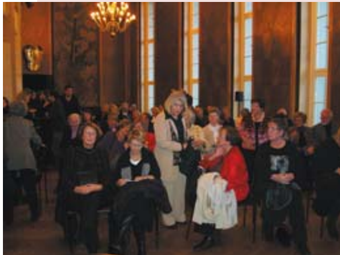
Im Mittelfoyer eifrig Diskutierende