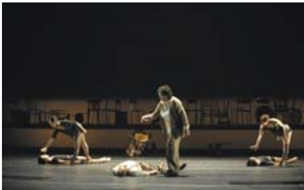
tänzerisch Trost spenden