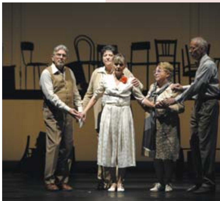
Wir stehen füreinander ein

que lève – tard et ayant tendance à un manque de ponctualité, j'ai eu d'abord du mal à m'habituer à la sonnerie du réveil et à être éveillée et en pleine forme lors des répétitions.