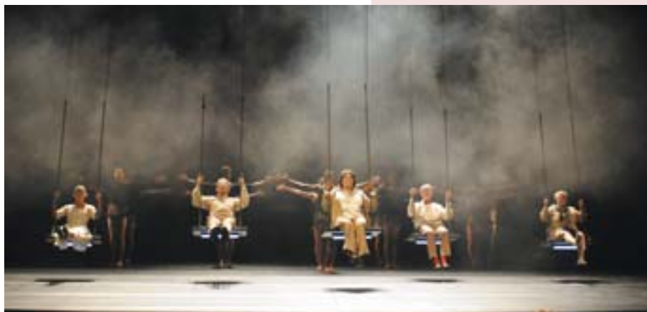
die Fünf schaukeln in der Vergangenheit

d'effarement, ils cachent leurs visages derrière leurs mains. « J'ai pu voir Sarrebruck en ruines, 80 % était sous les décombres, même l'église Ludwigskirche ». Embrassades lorsque le soldat fait ses adieux ; il ne reviendra pas ; à la fin une lettre... « Le jupon pour ma robe de mariée fut confectionné avec de la soie d'un parachute ». Chaque soir, lorsque tombe le rideau, un tonnerre