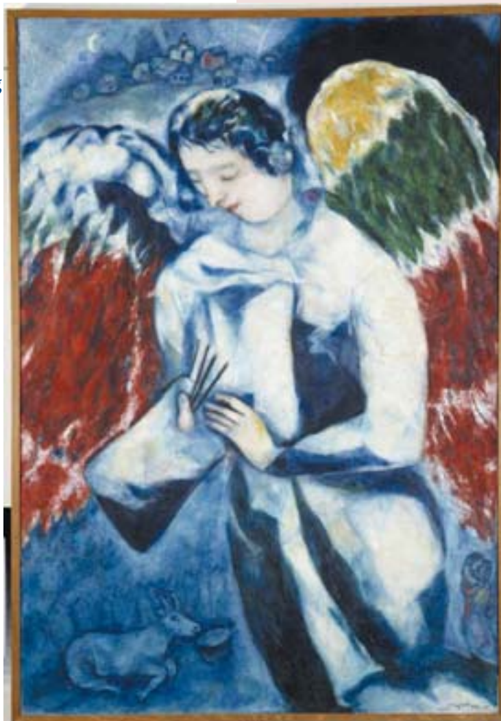
L'ange à la palette