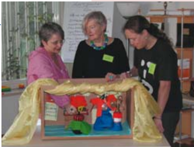
zum Thema Theater haben Teilnehmerinnen eine Präsentation erarbeitet

Andere Exkursionen führten ins Staatstheater, in die Stadtbücherei nach Neunkirchen, in die Illypse nach Illingen, in eine Tanzschule und ins Kino. Immer ging es auch um die Frage, „wie bürgerschaftliches Engagement in dem jeweiligen Kulturbereich umgesetzt werden kann“, berichten die Europ'age Teilnehmer. In drei Praxisprojekten erarbeiteten sie Aufgaben aus einem Kulturbereich. So gewannen sie neue Einblicke in die Themen Schmuck, Essen,